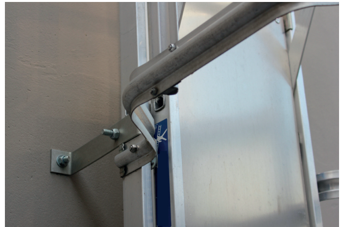
Fixation d'une échelle à crinoline sur mur béton avec goujon d'ancrage MTH-A4.