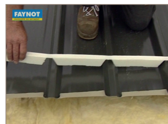
Closoir contre profil (faitage).